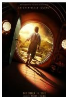
Hobbit: Niezwykła podróż (2012)