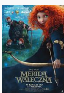
Merida waleczna (2012)