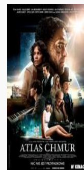
Atlas chmur (2012)