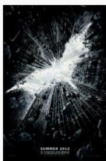
Mroczny Rycerz powstaje (2012)