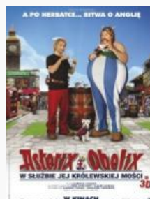
Asterix i Obelix: W służbie Jej Królewskiej Mości (2012)