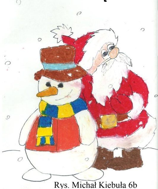
Rys. Michał Kiebuła 6b

Gazetka Zyg-Zak z okazji zbliżających się świąt Bożego Narodzenia chciałaby złożyć wszystkim Czytelnikom serdeczne życzenia: dużo zdrowia, pięknych ocen oraz sukcesów w nauce i konkursach. Życzymy Wam najpiękniejszych, najmilszych i najwspanialszych świąt.